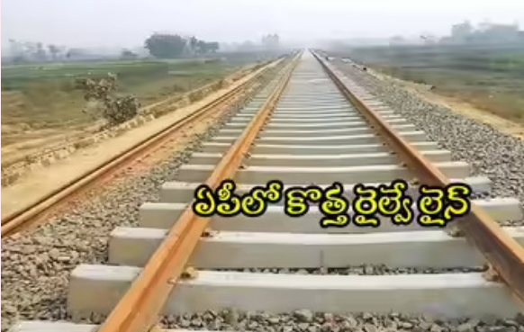
ఏపీలో కొత్త రైల్వే లైన్

ఏపీలో కొత్త రైల్వే లైన్ కు సంబంధించి కేంద్రానికి రిక్వెస్ట్ వెళ్లింది. కడప నుంచి బెంగళూరుకు కొత్త రైలు మార్గంపై రాజమహేంద్రవరం ఎంపీ దగ్గుబాటి పురందేశ్వరి రైల్వేమంత్రి అశ్వినీ వైష్ణవ్ కు వినతిపత్రాన్ని అందజేశారు. ఈ రైల్వే లైన్ రాయలసీమ అభివృద్ధికి కీలకమైనదని పురందేశ్వరి